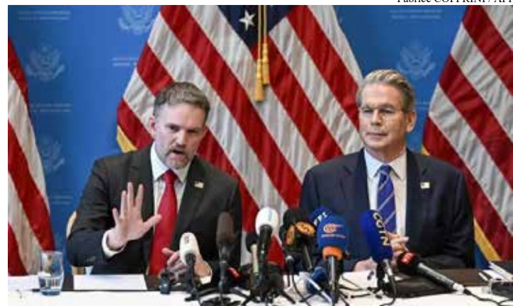
O representante do Departamento de Comércio norte-americano, Jamieson Greer (à esq.), ao lado do secretário do Tesouro dos EUA, Scott Bessent

A definição do governo dos Estados Unidos sobre a imposição de novas tarifas às importações brasileiras deve ser anunciada muito em breve. A sinalização foi feita na quinta-feira (09) pelo representante do Departamento de Comércio norte-americano, Jamieson Greer. Ele afirmou, porém, que Brasil e Estados Unidos ainda estão longe de um entendimento e que a decisão precisa ser tomada até 15 de julho, prazo previsto na legislação norte-americana. A discussão ocorre após o presidente dos Estados Unidos, Donald Trump, anunciar, em 1º de junho, a intenção de aplicar uma tarifa de 25% sobre produtos brasileiros, com base em uma investigação que abrange temas como desmatamento ilegal, pirataria e o sistema de pagamentos Pix. No dia seguinte, o governo norte-americano anunciou uma tarifa adicional de 12,5% para 60 países, entre eles o Brasil, sob a justificativa de falhas no combate ao trabalho forçado.