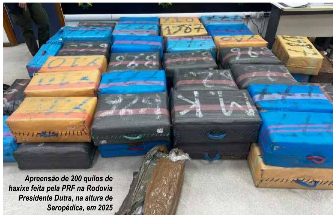
Apreensão de 200 quilos de haxixe feita pela PRF na Rodovia Presidente Dutra, na altura de Seropédica, em 2025

Segundo investigadores, a droga é levada para São Paulo e é depois distribuída para comunidades controladas pelo Comando Vermelho na Costa Verde e na Região dos Lagos