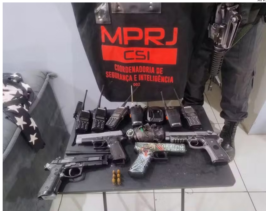
Material apreendido na operação do MPRJ contra policiais militares por peculato e comércio ilegal de arma de fogo

De acordo com o órgão, os agentes se apropriaram de uma arma apreendida durante uma operação policial, venderam por R$ 6 mil e dividiram o dinheiro obtido com a negociação