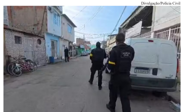
Agentes nas ruas para cumprir mandados de prisão e de busca e apreensão

Policiais civis da 34ª DP (Bangu) deflagraram, na terça-feira (30/6), uma operação para desarticular o braço financeiro da facção criminosa Amigos dos Amigos (ADA), com atuação na comunidade da Vila Vintém, na Zona Oeste do Rio. As investigações apontam que o grupo movimentava cerca de R$ 500 mil por semana em um esquema de lavagem de dinheiro ligado ao tráfico de drogas. A ação aconteceu em Bangu e Realengo, com apoio de agentes da Coordenação de Recursos Especiais (Core), do Departamento-Geral de Polícia da Capital (DGPC) e do Departamento-Geral de Polícia Especializada (DGPE), para cumprir mandados de prisão e de busca e apreensão.