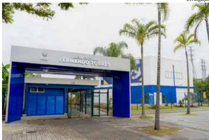
Evento na Arena Fernando Torres reunirá especialistas para debater o futuro da mobilidade urbana, os resultados do novo Terminal Margaridas e premiar projetos sustentáveis na Região Metropolitana

Nesta sexta-feira (26), a Secretaria de Integração Metropolitana (SEIM) realizará o seminário Caminhos para a Integração e o Desenvolvimento Sustentável das Cidades. O evento será às 13h, na Arena Fernando Torres (Parque Madureira), e vai debater como a conexão entre diferentes modais de transporte pode reduzir o tempo de viagem, diminuir a fragmentação do sistema e promover um ecossistema urbano mais eficiente e menos poluente na Região Metropolitana. O encontro é voltado para servidores públicos, estudantes, trabalhadores, moradores, gestores e autoridades da região metropolitana interessados no tema.