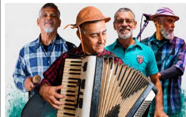
Forró Du Capim

do durante o aprendizado. Esse Projeto se aplica aos outros instrumentos dos cursos de formação. A primeira edição será dedicada ao curso de guitarra.