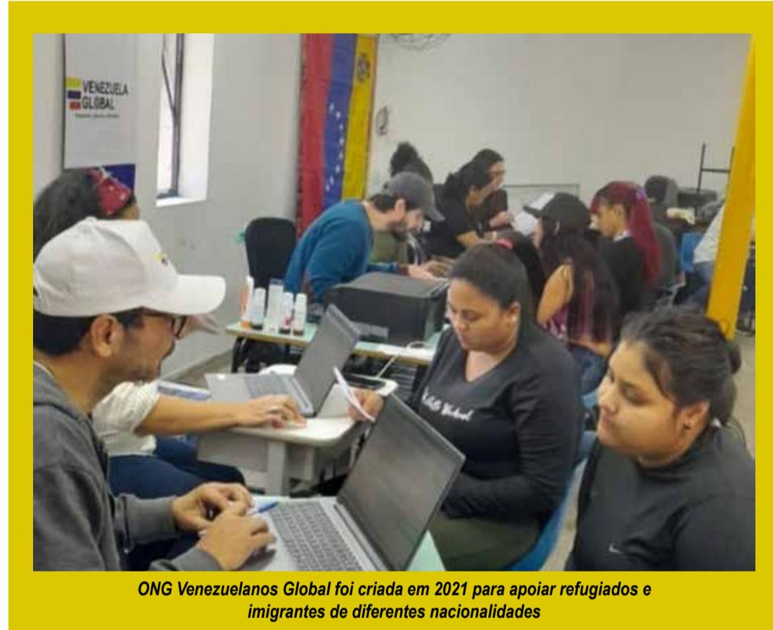
ONG Venezuelanos Global foi criada em 2021 para apoiar refugiados e imigrantes de diferentes nacionalidades

No Brasil, instituições públicas, organismos internacionais e organizações da sociedade civil atuam no atendimento a refugiados, solicitantes de refúgio e migrantes. Entre as principais referências estão a ACNUR, Agência da ONU para Refugiados, que apoia ações