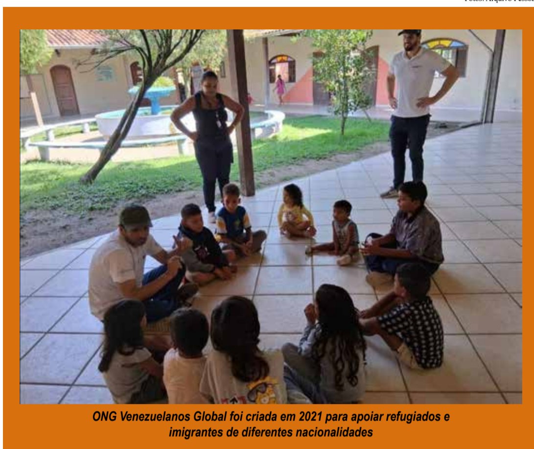
ONG Venezuelanos Global foi criada em 2021 para apoiar refugiados e imigrantes de diferentes nacionalidades