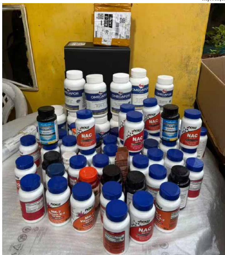
Quadrilha é investigada por fabricar e comercializar suplementos alimentares e produtos com finalidade terapêutica falsificados

De acordo com o documento, os suspeitos utilizavam plataformas de comércio eletrônico para anunciar suplementos de marcas conhecidas, com fotos semelhantes às dos produtos originais e preços considerados atrativos para os consumidores.