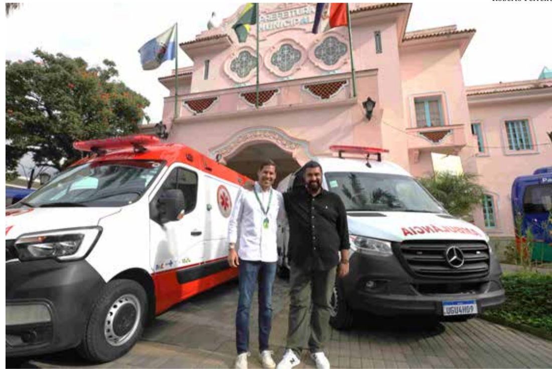
Prefeito Leonardo Vasconcellos e o secretário de Saúde, Fábio Gallote

A Prefeitura de Teresópolis, por meio da Secretaria Municipal de Saúde, recebeu nesta terça-feira, 26 de maio, cinco veículos zero quilômetro do programa 'Agora tem Especialistas - Caminhos da Saúde', do Ministério da Saúde, ampliando o atendimento e o acesso da população a serviços especializados do SUS.