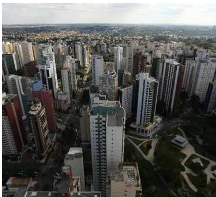
Curitiba: capital paranaense é capital com melhor qualidade de vida do Brasil

que realmente importa na vida das pessoas, diferente de métricas tradicionais, que olham principalmente o quanto foi gasto em determinada área, para olhar o que de fato as pessoas se beneficiaram com o investimento que foi feito".