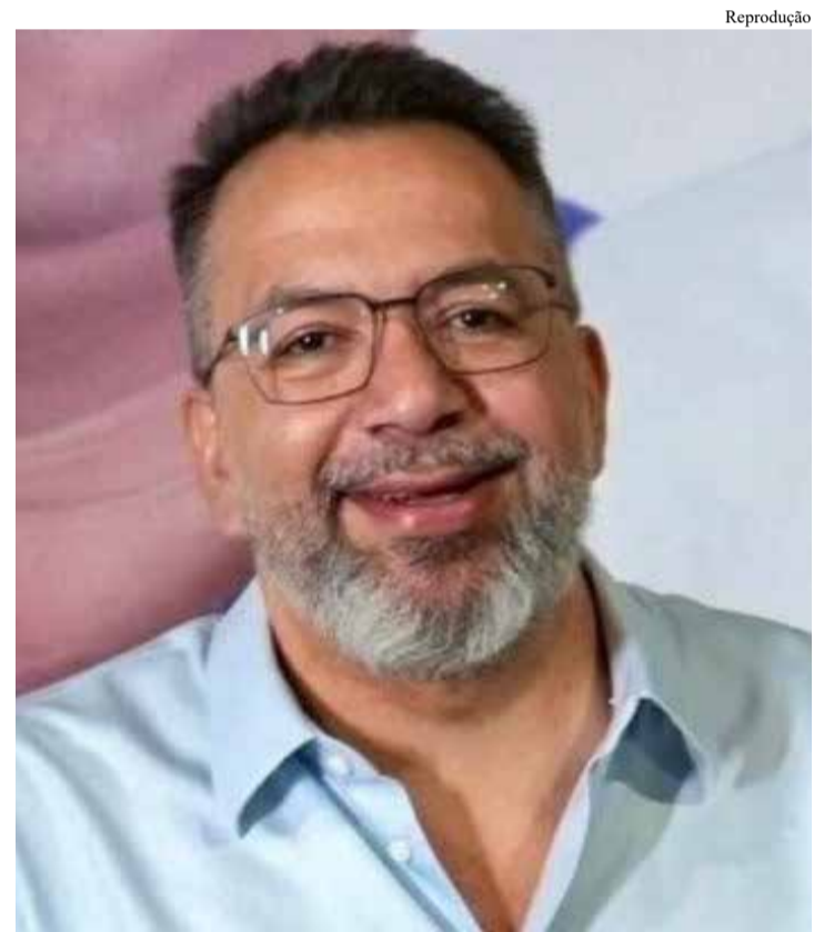
MPRJ está em fase inicial de investigações contra Márcio Canella, candidato do União Brasil ao Senado apoiado por Flávio Bolsonaro

O Ministério Público do Rio de Janeiro (MPRJ) abriu um procedimento, na primeira semana de maio, para investigar supostos crimes cometidos pelo ex-prefeito de Belford Roxo Márcio Canella, um dos candidatos de Flávio Bolsonaro ao Senado pelo estado. O político é filiado ao União Brasil.