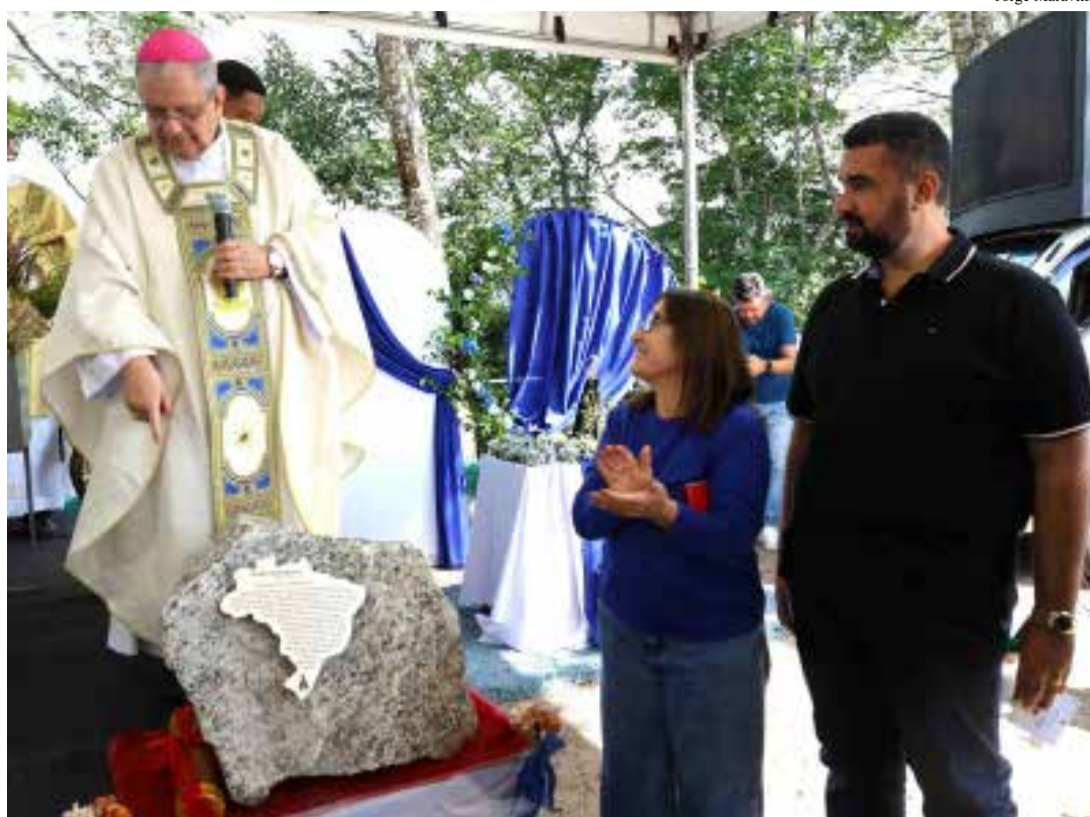
Prefeito Leonardo Vasconcellos e a vice-prefeita Afaf Ribeiro durante a bênção da pedra fundamental pelo bispo Dom Joel Portella

Turismo religioso: Para o deputado federal Hugo Leal, que acompanhou a cerimônia, a iniciativa movimentará o turismo religioso em Teresópolis. "Foi uma brilhante