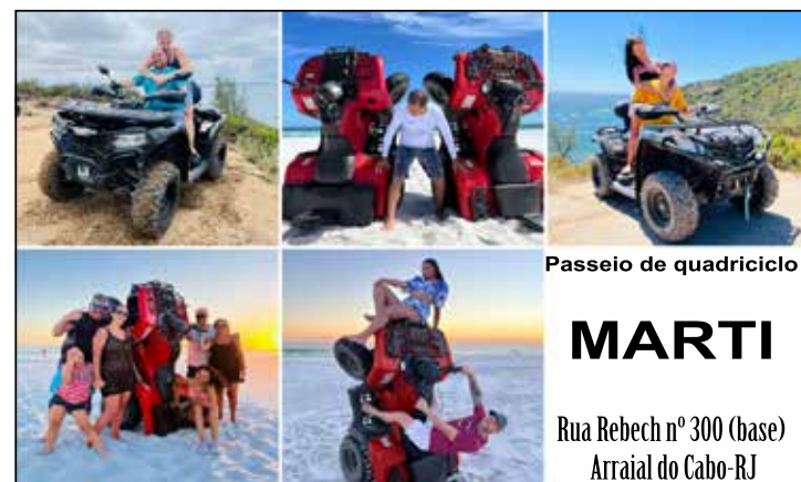
Passeio de quadriciclo

Foi determinado cumprimento das exigências contidas nas normas e Instruções de Licenciamento da SEMMA.