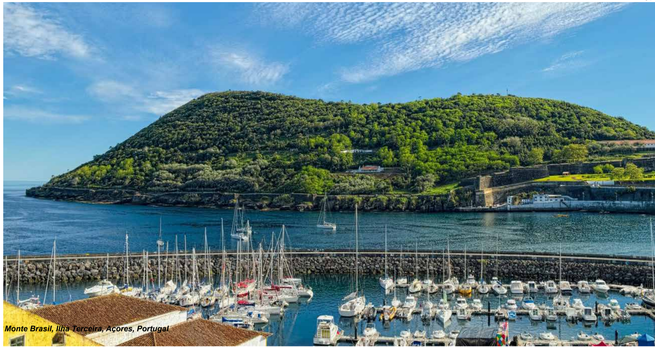
Monte Brasil, Ilha Terceira, Açores, Portugal

Os Açores são um arquipélago formado por nove ilhas vulcânicas, sendo um dos destinos mais impressionantes de Portugal. Localizados no meio do Oceano Atlântico, os Açores oferecem uma mistura única de paisagens deslumbrantes, clima ameno e uma cultura rica e autêntica. O destino é perfeito para quem busca aventura, tranquilidade e contato com a natureza. Pág. 5