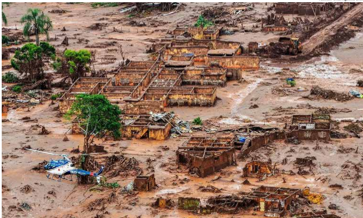
Quebra da barragem da mina Córrego do Feijão, em Brumadinho (MG)

A Corte Distrital de Munique marcou para o final deste mês de maio uma série de audiências fundamentais no processo que envolve cerca de 1,4 mil vítimas. O foco central é a responsabilidade da holding alemã que emitiu o laudo de estabilidade