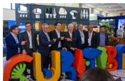
O prefeito de Curitiba, Eduardo Pimentel, e autoridades na Expo Turismo Paraná 2026

A solenidade de abertura da Expo Turismo Paraná, evento anual realizado e promovido pela Associação Brasileira de Agências de Viagens do Paraná (ABAV-PR), aconteceu em Curitiba na manhã de quinta-feira (07) em clima de comemoração. A edição marca a 30ª edição da feira, consolidada como um dos principais encontros B2B do turismo no Sul do Brasil. O marco foi chancelado por entidades e autoridades presentes.