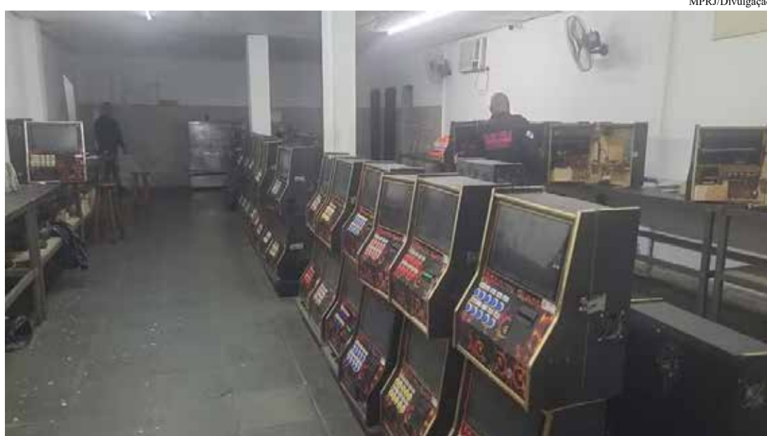
Máquinas caça-níqueis encontradas durante a operação