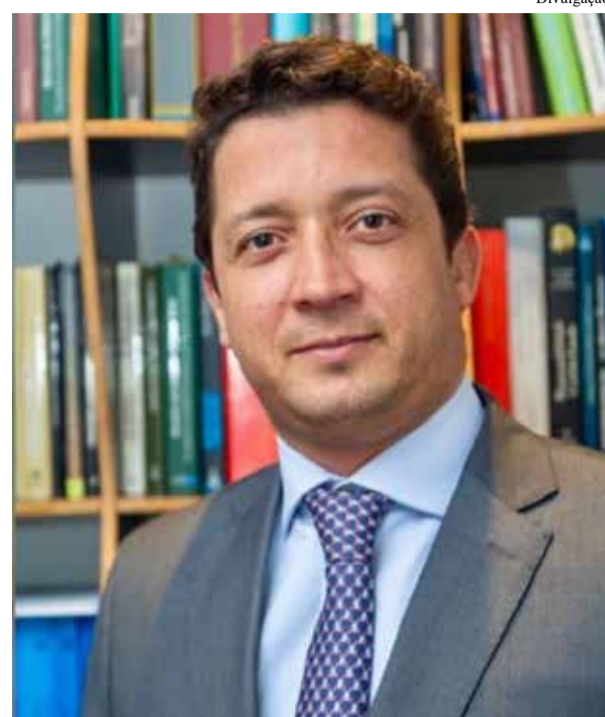
Bruno Dubeux - Procurador-Geral do Estado

anos de 2020 e 2023, tendo sido responsável pela criação da Comissão Especial para Combate ao Racismo Estrutural e Institucional (CECREI) e da Comissão Especial para Promoção da Igualdade de Gênero, ambas instituídas em 2021. A nomeação foi publicada no Diário Oficial.