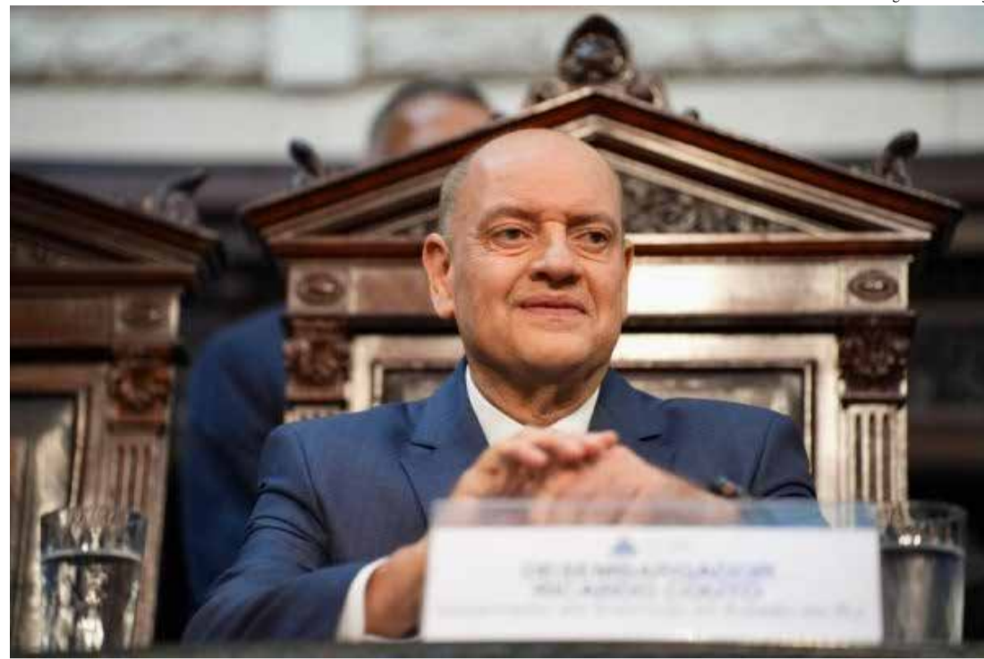
Ricardo Couto assina decreto que endurece fiscalização sobre contratos milionários no Governo do estado do Rio

Entre uma exoneração e outra, o governador em exercício do Rio, desembargador Ricardo Couto de Castro, aproveitou a edição de ter-