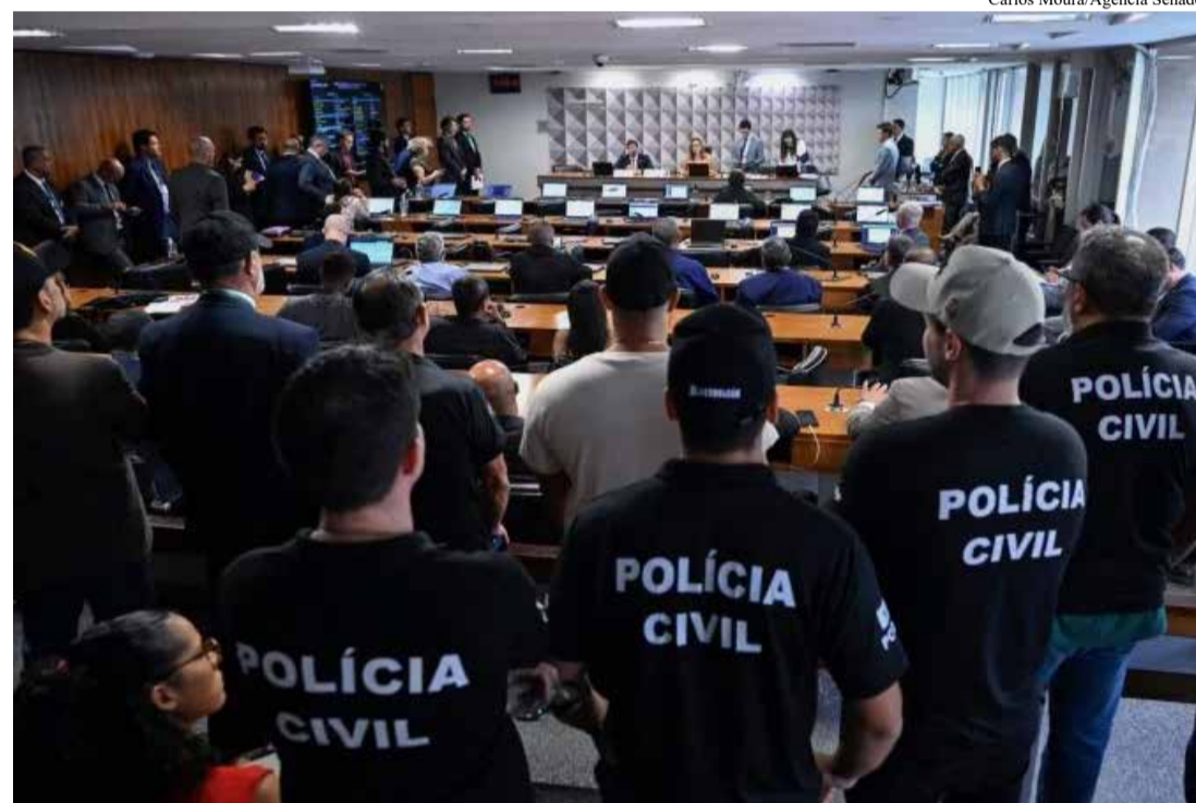
A nova legislação, publicada nesta terça-feira (28/4), já está em vigor e abrange a Polícia Militar (PMDF), o Corpo de Bombeiros Militar (CBMDF) e a Polícia Civil (PCDF), além de militares dos ex-Territórios Federais

Os critérios físicos para ingresso também foram mo-