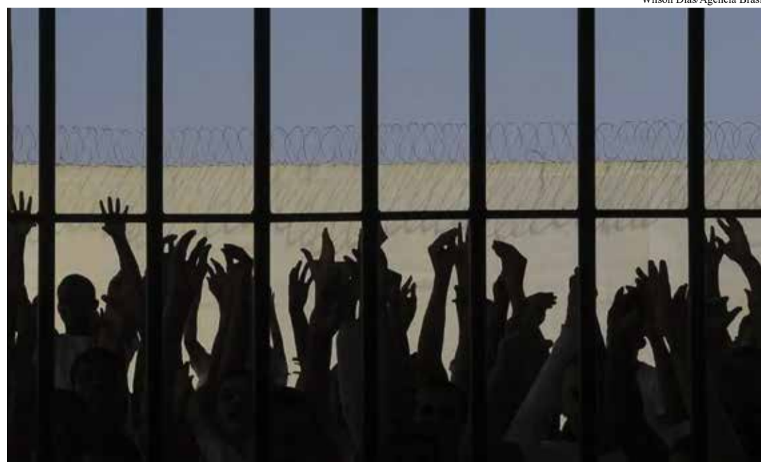
Wilson Dias/Agência Brasil

O relatório foi produzido por pesquisadoras do Núcleo de Estudos da Violência da Universidade de São Paulo (NEV-USP) a partir de audiência pública realizada no mês passado pelo Condepe, em parceria com a Defensoria Pública de SP, Conselho Penitenciário do estado (Copen), Ordem dos Advogados do Brasil (OAB)