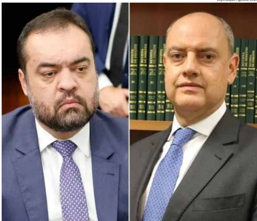
A retirada do dinheiro foi feita no 'apagar das luzes', horas antes do então governador Cláudio Castro renunciar ao cargo

A lista dos milhões contempla um total de 16 municípios no interior do Rio,