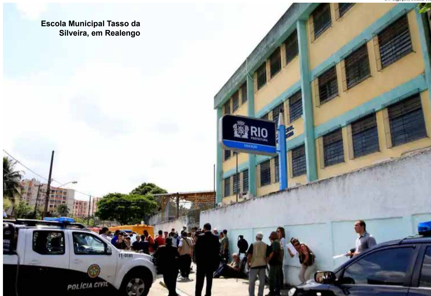
Escola Municipal Tasso da Silveira, em Realengo