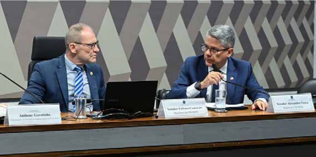
O senador Fabiano Contarato é presidente e o senador Alessandro Vieira, relator da CPI

A pauta tem ainda requerimentos de convite e