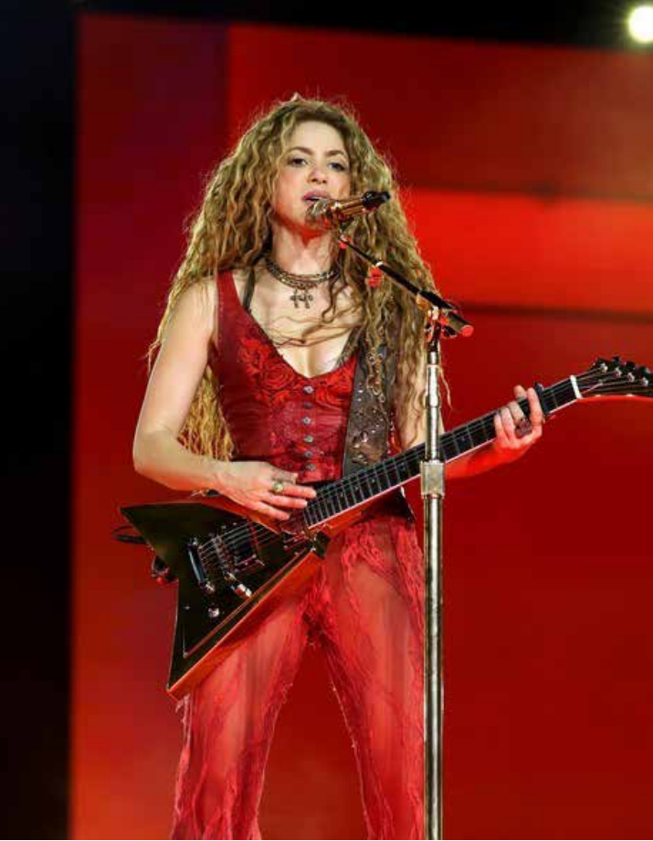
Shakira no Engenheiro no início da turnê Las Mujeres Ya No Lloran