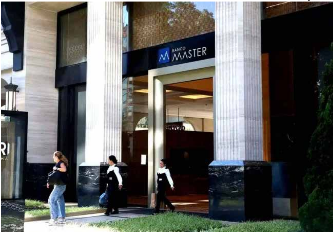
Transparência Internacional aponta a existência de contratos de alto valor firmados entre a instituição financeira e escritórios de advocacia ligados a autoridades públicas

As investigações envolvendo o Banco Master e o esquema de fraudes no Instituto Nacional do Seguro Social (INSS) expõem fragilidades estruturais no sistema brasileiro de controle da corrupção, avalia a ONG Transparência Internacional. Os dois casos são destacados no relatório Retrospectiva 2025, divulgado na terça-feira (10), como exemplos de falhas de governança em setores estratégicos da economia formal e de infiltração do crime organizado no Estado.