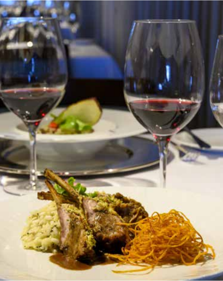
Rest. Le Château/Fernando Chiriboga

2. Vista Mar: O restaurante, aberto em meados do ano passado, possui uma vista privilegiada para o Morro do Careca. O cardápio é amplo e oferece diversas opções que vão de frutos do mar a pratos tradicionais da culinária nordestina. Para grupos de amigos ou famílias, a variedade é o destaque, pois há opções fartas para dividir. Iguarias como Filé ao Malbec, camarão no abacaxi são opções e bolinho de sol também são ótimas pedidas. https://www.instagram.com/restaurantevistamar