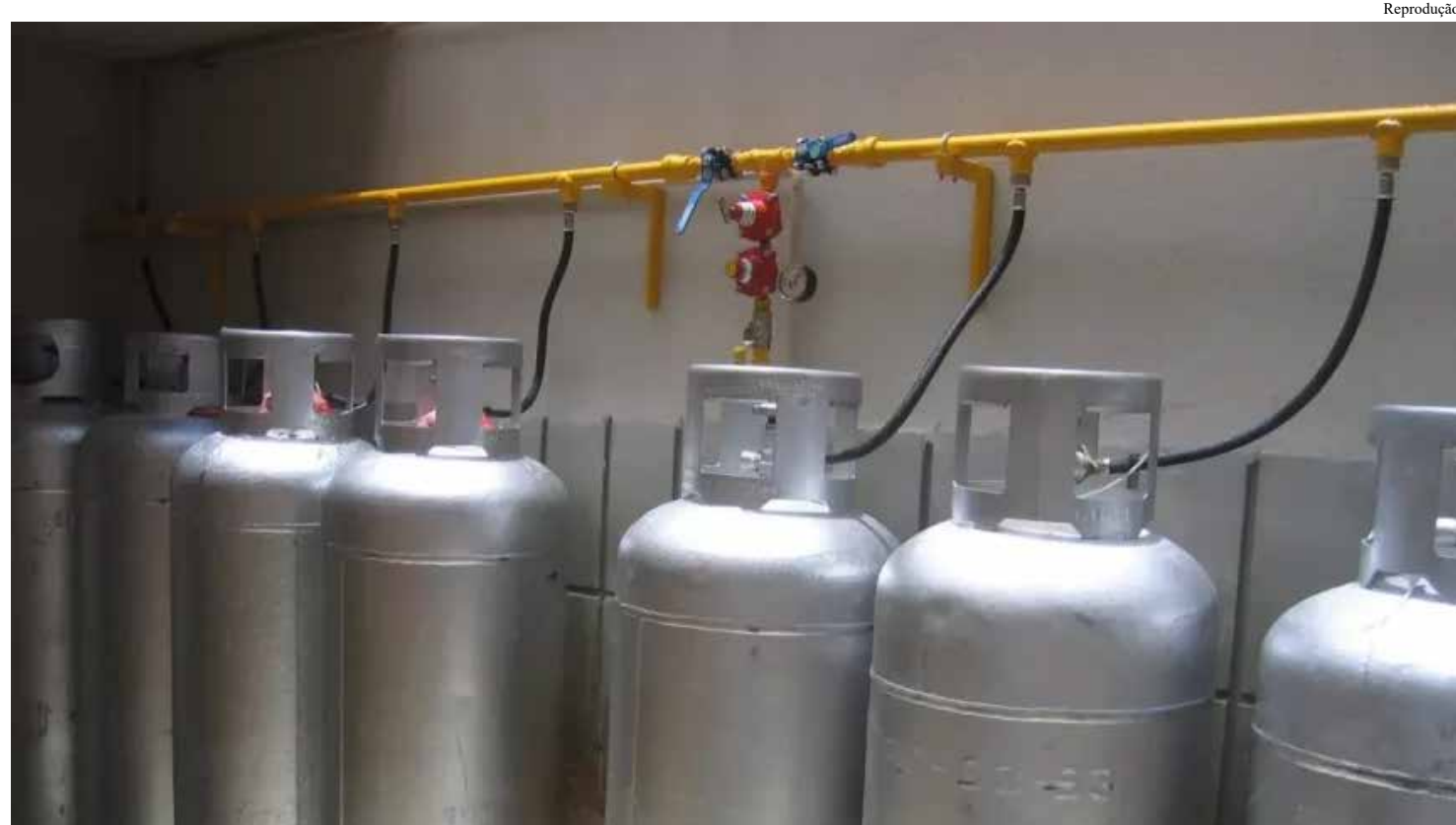
CPI quer investigar possíveis irregularidades antes de governo decidir se renova concessão do gás canalizado