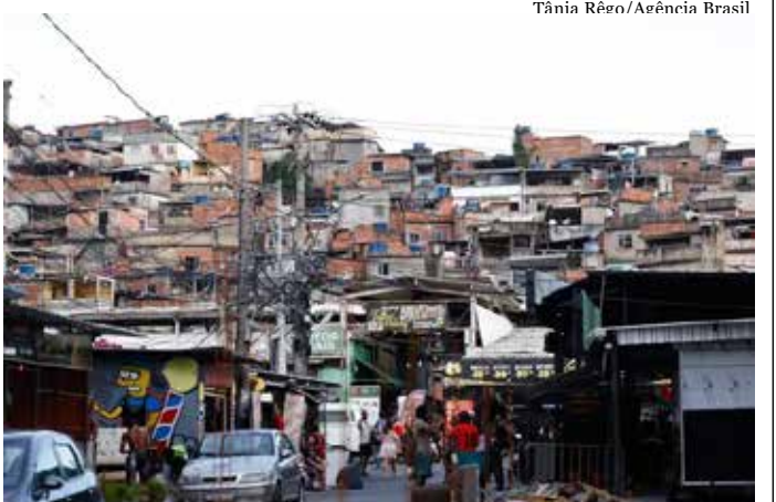
Complexo da Penha, na zona norte da cidade do Rio de Janeiro

As favelas brasileiras reúnem uma população majoritariamente jovem, negra, trabalhadora e com projetos concretos de futuro. Por outro lado, vivem com desafios estruturais persistentes em áreas que vão da educação à segurança. Essa é a realidade apresentada na pesquisa Sonhos da Favela , feita pelo Data Favela nas cinco regiões do Brasil, com ênfase no Rio de Janeiro e em São Paulo. Pág. 4