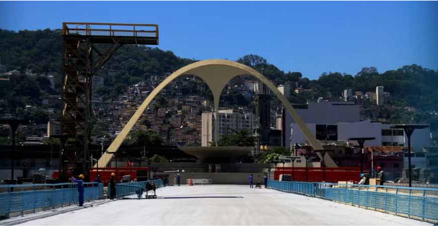
Estruturas na cor laranja formam a passarela retrátil, instalada perto dos arcos da Praça da Apoteose

— Superou muito as minhas expectativas. O som tem muita qualidade. (Inicialmente) Isso gerou uma dúvida em nós, cantores, e nas diretorias, porque a gente atuou por muitos anos com o caminhão de som dando o suporte de base de retor-