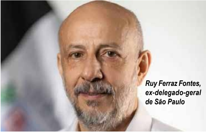
Ruy Ferraz Fontes, ex-delegado-geral de São Paulo

Azul começou a ficar de olho no ex-delegado desde 2019, quando, durante a gestão de Ruy Ferraz, foi incluído na lista de presos transferidos da Penitenciária de Presidente Venceslau para unidades federais, a pedido do Ministério Público de São Paulo.