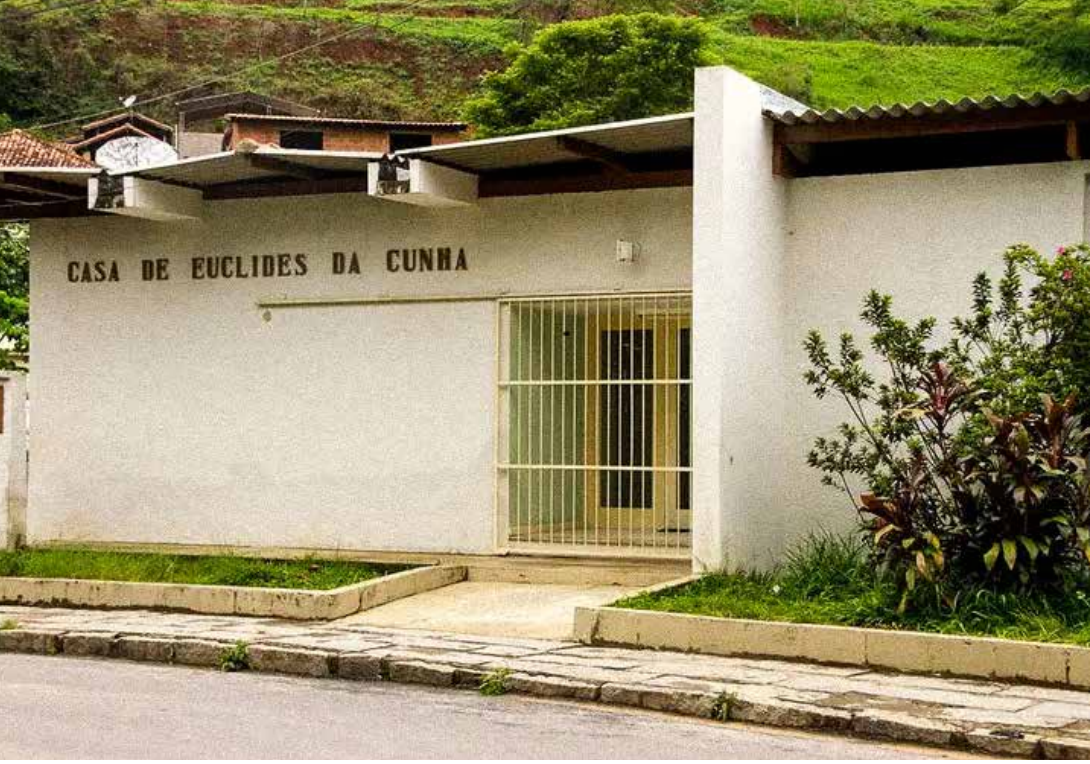
Casa Euclides da Cunha, em Cantagalo, no interior do Rio, agora integra o programa de museus antirracistas