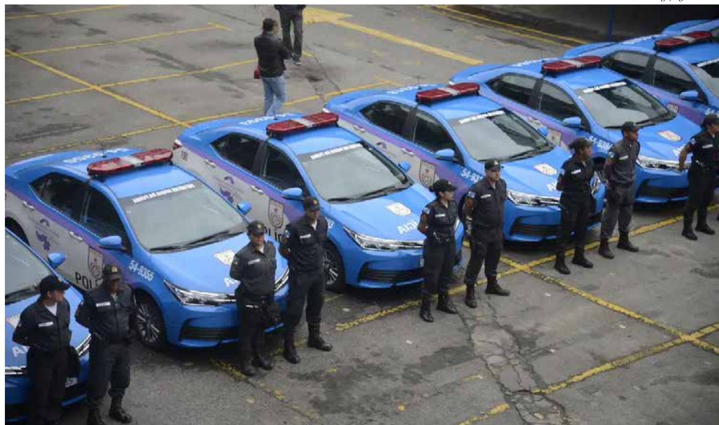
Tânia Régio/Agência Brasil

"Considerando o volume de pessoas, uma expectativa de 8 milhões no estado, em especial na cidade do Rio, onde 6 milhões circularam por blocos, houve um planejamento muito importante da Polícia Militar, utilizando esquemas como blocos de revista e utiliza-